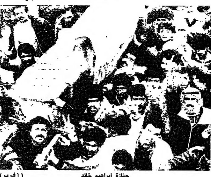
جائزة ابراهيم خالد